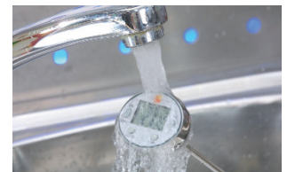
제품이 오염되면 흐르는 물에 세척 가능