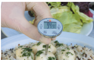
식품 온도 검사