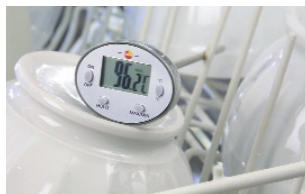
주위 온도 측정, 예, 식기 세척기