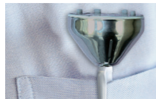
홀더가 있는 보호 슬리브